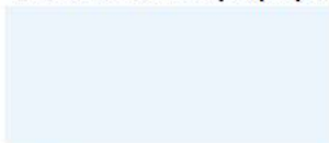
911 - Bianco White | Blanc

Sedili e schienali in polipropilene | Seats and backrest in polypropylene | Assise et dossier en polypropylène