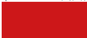
914 - Rosso Red | Rouge